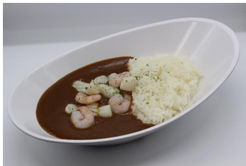
シーフードカレー -味噌汁付き-