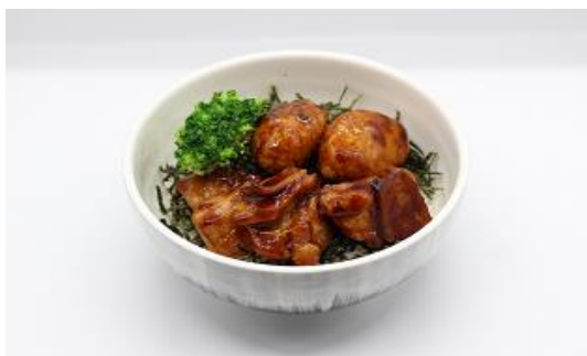
鶏肉の照り焼き2色丼 -味噌汁付き-